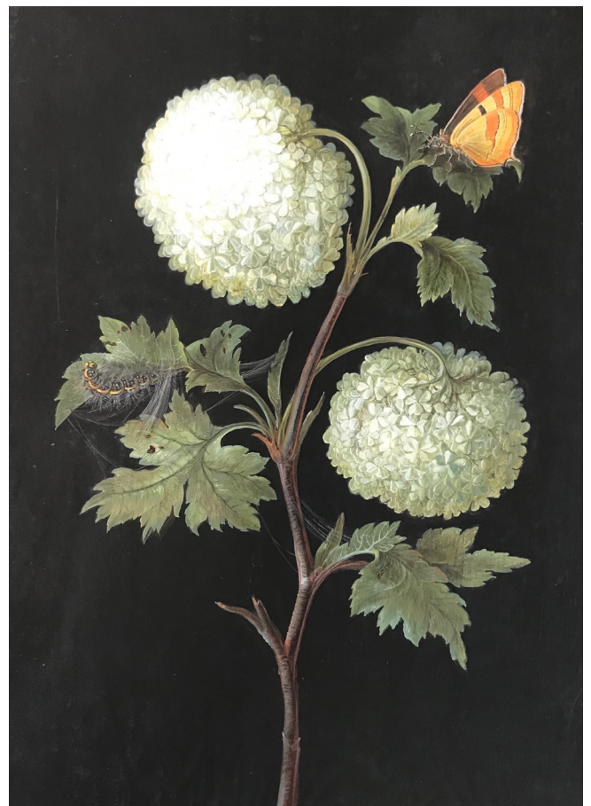
Barbara Regina Dietzsch, Skogsolvon (Viburnum opulus) med eldsnabbvinge och spinnarlarv , odaterad. Inv.-Nr. Norica285, Germanisches Nationalmuseum, Nürnberg. Leihgabe Museen der Stadt Nürnberg, Kunstsammlung